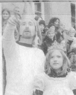
Le Conte Abracadabrant.

Le pavé wasselonnais a vu éclore samedi une multitude de fleurs répandant sur la ville leurs pétales de poésie, d'humour d'intelligence et de tendresse. Petit hommage photographique à de grands artistes qui ont fait muer la rue.